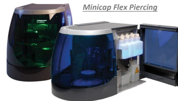
Minicap Flex Piercing